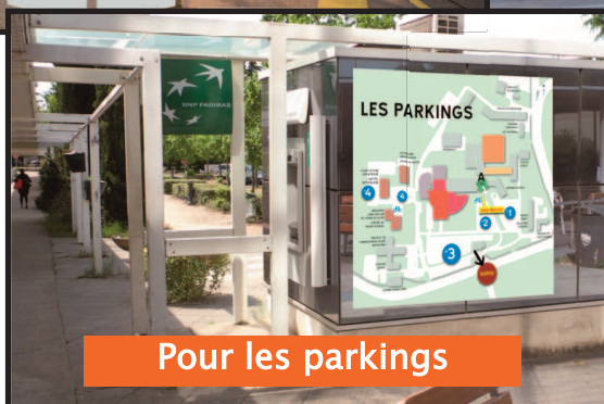
Pour les parkings