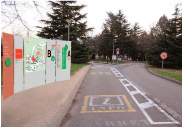
Pour les automobilistes